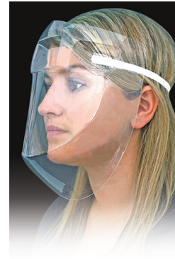
Fabriquée au Canada Made in Canada