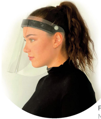
Fabriquée au Québec Made in Québec