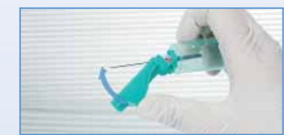
6 Activer le mécanisme de sécurité (à l'aide d'une surface solide ou du pouce)