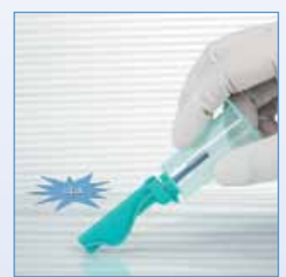
7 Effectuer la mise en sécurité jusqu'au « clic » sonore