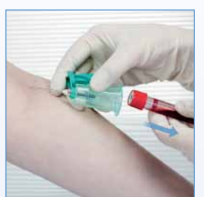
5 Retirer et homogénéiser le tube