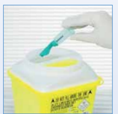
8 Eliminer l'ensemble dans un collecteur adapté