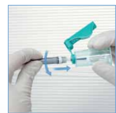
1 Visser l'aiguille **