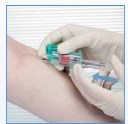
4 Insérer et maintenir le tube