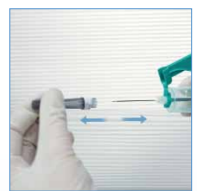
2 Retirer le capuchon