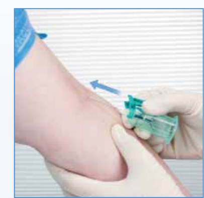
3 Effectuer la ponction veineuse