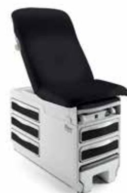
Table d'examen manuelle Ritter 204

Dessus de garniture sans coutures UltraFree Le dessus de garniture sans coutures UltraFree sans PVC est une option confortable et facile à nettoyer pour votre cabinet.