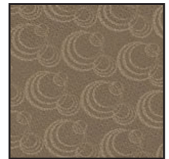
BULLE DE CHAMPAGNE FONCÉ