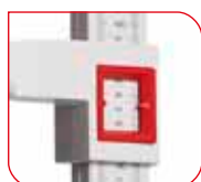
Deux grandes fenêtres latérales facilitent la lecture des graduations.