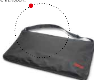
Sacoche seca 412 pour le transport.