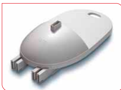
Poignée intégrée et butées sécurisées permettant un transport facile.