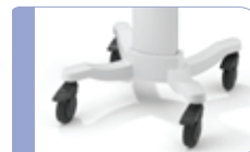
Le modèle ici présenté dispose des roues adaptées aux hôpitaux

Choix d'accessoires : Électrodes réutilisables/jetables AHA/IEC