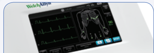
VISUALISATION DU BON CONTACT DES ÉLECTRODES

Clavier intégré à l'écran pour gagner du temps et réduire les risques d'erreurs.