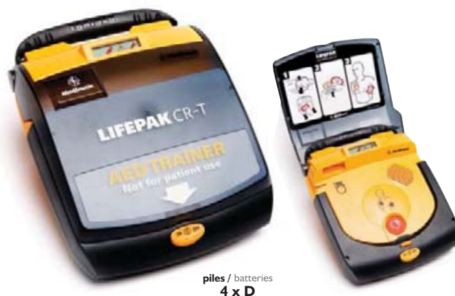
piles / batteries 4 x D