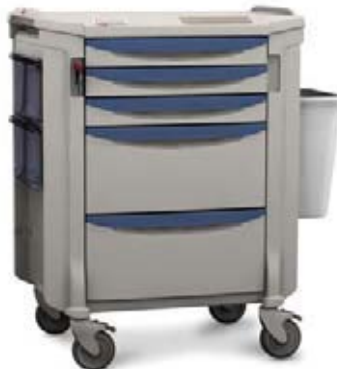
CHARIOT À MÉDICAMENTS STARSYS™ AVEC SYSTÈME DE CASSETTES STARSYS™ MEDICATION CART WITH CARTRIDGE SYSTEM