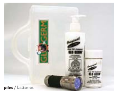
piles / batteries 3 x AAA

CHACUN DES PRODUITS AUSSI VENDU SÉPARÉMENT EACH PRODUCT ALSO SOLD SEPARATELY