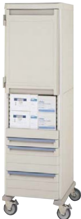
SYSTÈME DE RANGEMENT ET CHARIOT DE TRANSPORT METROMAX® METROMAX® CART AND STORAGE