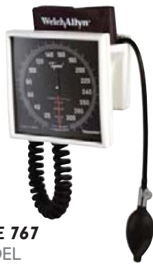
MODÈLE 767 767 MODEL