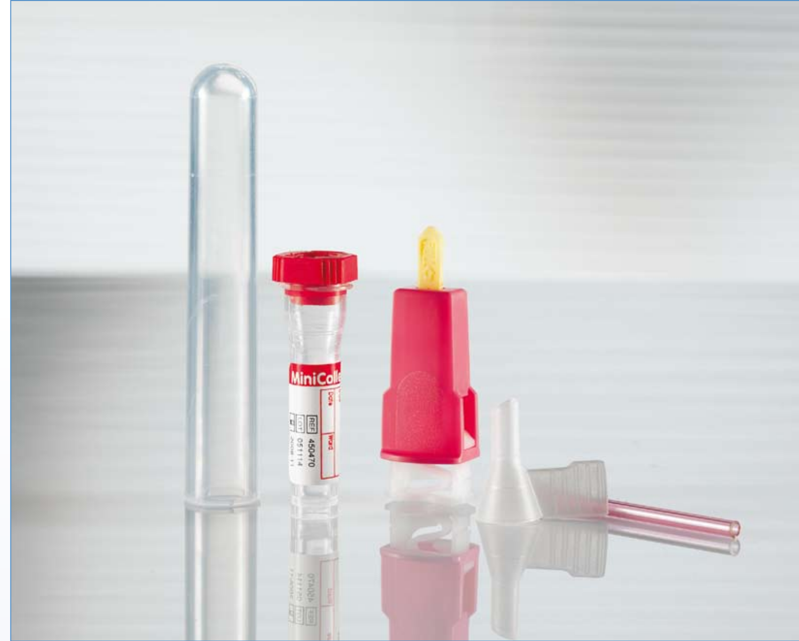
MiniCollect® Système de prélèvement sanguin capillaire

* uniquement approprié pour le sang veineux, sans dosage à pulvérisation