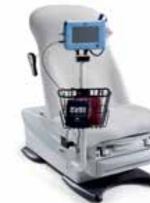
IQvitals® à montage sur table Montage sur table pratique pour le moniteur de signes vitaux Midmark IQvitals®, conçu pour s'adapter à tous les fauteuils d'examen Midmark et Ritter.