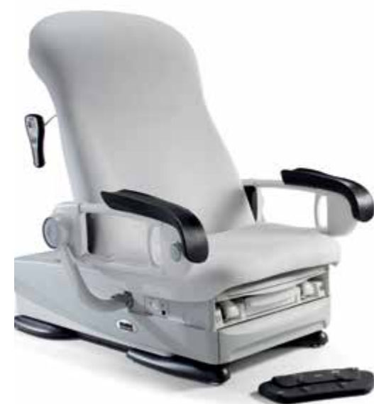
Fauteuil d'examen Midmark 626 Barrier-Free®