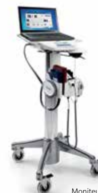
Moniteur sans fil IQvitals Zone avec dispositif Masimo SpO 2 sur chariot mobile