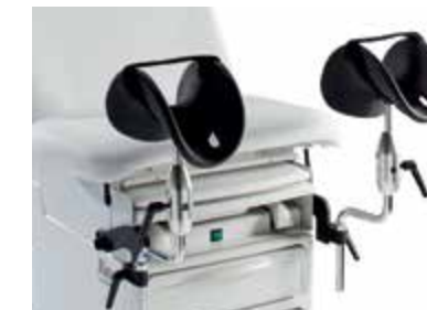
Supports de genoux articulés La conception unique de la rotule permet une plage de réglage maximale, conçue pour assurer un soutien optimal des genoux et des jambes. Disponible en version non articulée.