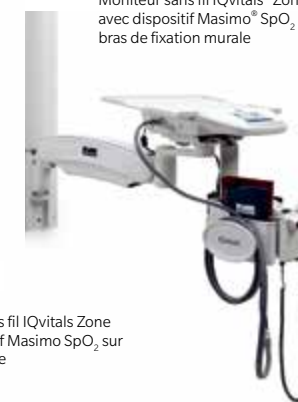
Moniteur sans fil IQvitals® Zone™ avec dispositif Masimo® SpO 2 sur bras de fixation murale