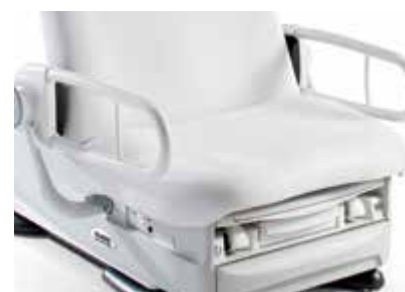
Patient Support Rails™ Fournissent aux patients une prise non glissante et continue de 3,1 cm (1,25") de diamètre pour s'asseoir, se lever ou se repositionner sur le fauteuil d'examen.