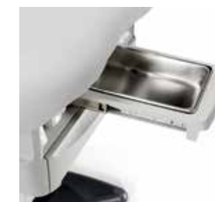
Cuvette en acier inoxydable Idéale pour les procédures liées au bas du corps ou dans d'autres situations où l'élimination des liquides et des débris est nécessaire.