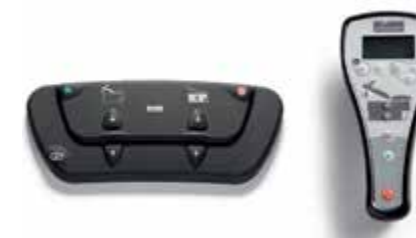
Commandes sans fil Localisez la pédale de commande et la commande manuelle n'importe où dans la pièce, sans câbles d'alimentation et sans obstacles.