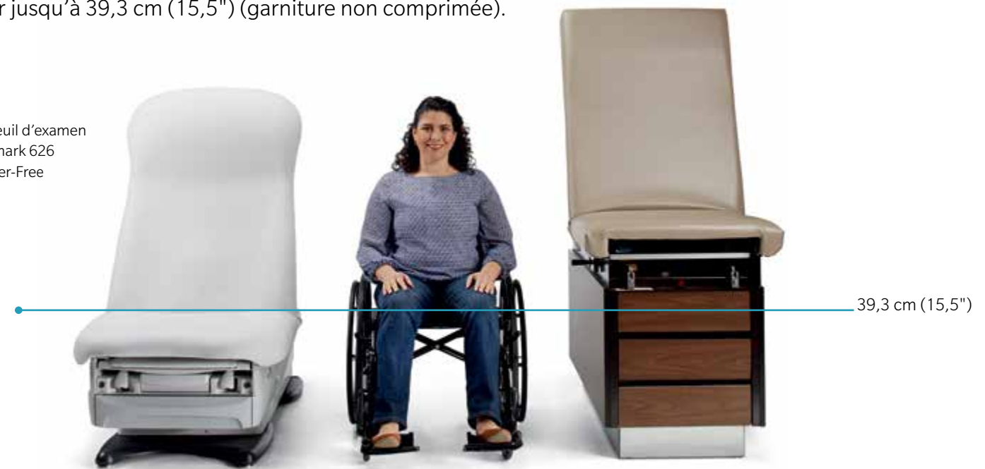
Fauteuil d'examen Midmark 626 Barrier-Free

L'un des facteurs clés ayant une incidence sur l'accessibilité de l'espace d'examen est le fauteuil d'examen. L'agence fédérale chargée de fournir des directives et des orientations en matière de conception accessible, la US Access Board, recommande l'utilisation d'un fauteuil d'examen de hauteur d'assise basse non comprimée de 43,2 à 48,2 cm (17" à 19"). Les fauteuils d'examen Midmark Barrier-Free® sont les seuls fauteuils sur le marché qui peuvent aller jusqu'à 39,3 cm (15,5") (garniture non comprimée).