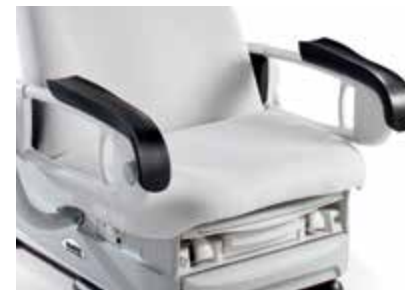
Patient Support Rails Plus™ Aident à obtenir un bon positionnement du bras du patient pour prendre la pression artérielle.