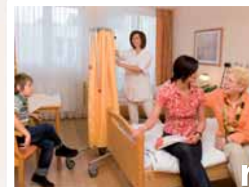
Ecran mobile avec télescopes pliés vers le bas

L'écran mobile 95 est mis en place en quelques secondes et se range rapidement après utilisation. Grâce à sa légèreté il roule très facilement et sa haute stabilité garantit un agréable maniement. L'écran mobile utilisé avec un ou deux télescopes est idéal pour la séparation mobile dans les couloirs, dans les chambres à plusieurs lits, aux urgences et dans tous les domaines de la santé.