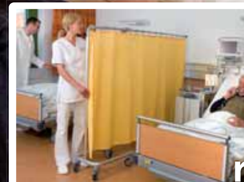
Ecran mobile 95 avec un télescope en maison de retraite