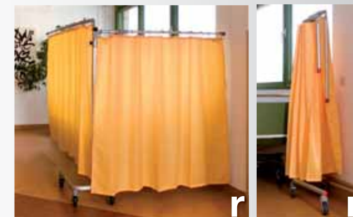
Ecran mobile 95 avec deux télescopes

Ecran mobile FG 95, télescope pliable RTI 2.2 max. 220 cm, support universel UKB pour le deuxième télescope, télescope RTI 1.6 pliable max. 160 cm, rideau TCS 212 dim. 230x140 cm, rideau TCS 152 dim. 170x140 cm