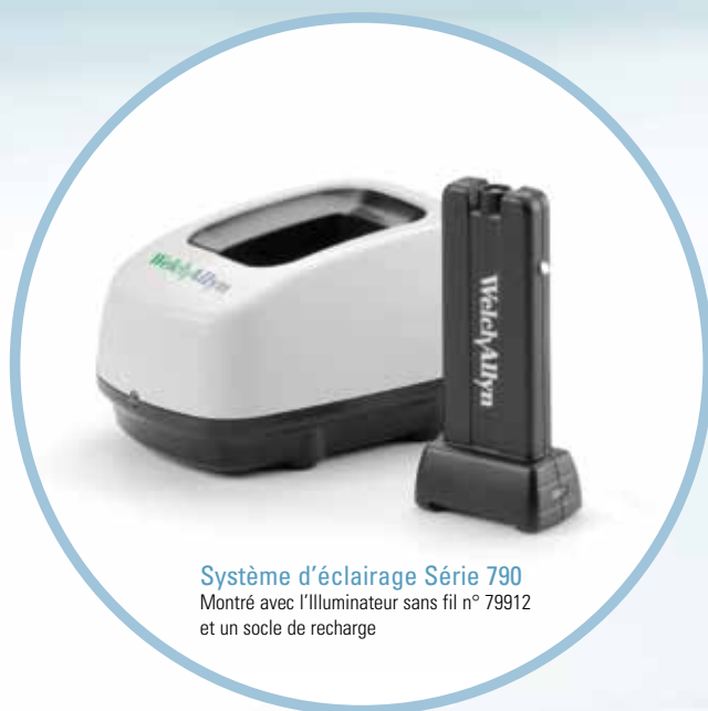
Système d'éclairage Série 790 Montré avec l'illuminateur sans fil n° 79912 et un socle de recharge