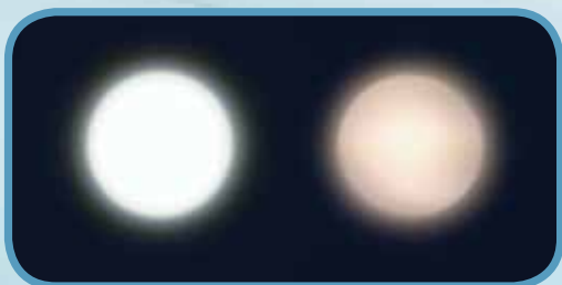
LED PAR RAPPORT À L'HALOGÈNE

De plus, les diodes électroluminescentes (LED) blanches de 5 500° K, comparativement aux lampes à halogène, vous procurent une lumière de qualité supérieure, plus blanche et brillante qui favorise une vision plus réelle de la couleur des tissus pendant un examen.