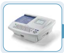
CP 100™ de Welch Allyn Transfert des informations via une carte mémoire SD